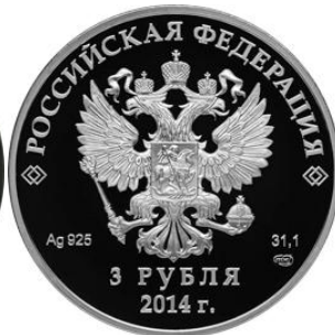
Хоккей – 14

Реверс: в центральной части диска - рельефное изображение хоккеиста, ведущего шайбу, справа от него в три строки - надпись: "СОЧИ", дата: "2014" и пять олимпийских колец, слева внизу, у канта - цветное изображение ветви пробкового дуба.