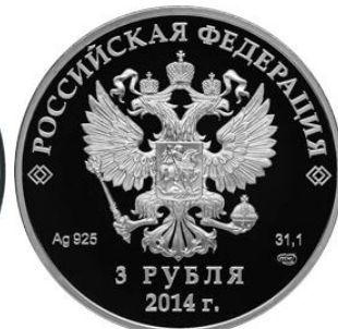
Шорт трек – 14

Реверс: в центральной части диска - рельефное изображение конькобежца в стиле "шорт-трек", внизу в три строки - надпись: "СОЧИ", дата: "2014" и пять олимпийских колец, внизу слева, у канта - цветное изображение колокольчика Отрана.