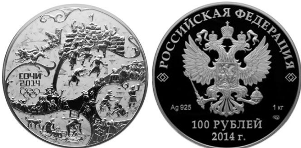
Городок – 14

Аверс: в центре диска - рельефное изображение Государственного герба Российской Федерации, слева - обозначение вида металла и пробы сплава, справа - содержание металла в чистоте и товарный знак монетного двора, внизу у канта - горизонтальная надпись: "100 РУБЛЕЙ", под ней - дата: "2014 г.".