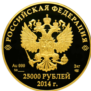
Олимпийское движение – 14

Реверс: в центральной части матового диска – рельефное изображение античного героя Прометея с факелом и представителей семи видов спорта, внизу имеются: в две строки надпись "СОЧИ" и дата "2014", под ними – пять олимпийских колец.