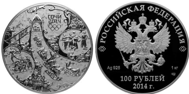
Горка – 14

Реверс: на матовом диске изображения людей: в центре - катающихся с ледяной горки, справа – играющих в мяч, слева - катающихся на коньках и прогулочных санях, в верхней части имеются: в две строки надпись "СОЧИ" и дата "2014", под ними – пять олимпийских колец.