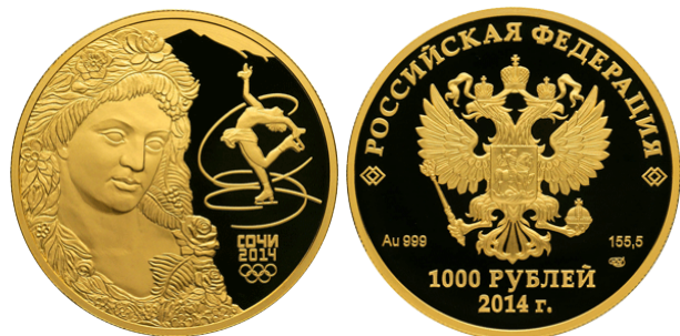
Флора – 14

Реверс: в левой части диска - рельефное аллегорическое изображение богини Флоры, справа на зеркальном поле - фигуристка, исполняющая круговые движения на льду, под ней в три строки - надпись: "СОЧИ", дата: "2014" и пять олимпийских колец.