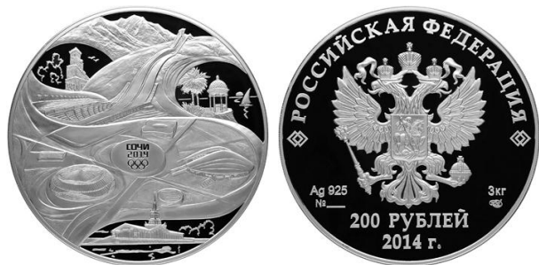
Спорт- сооружения - 14

Аверс: в центре диска - рельефное изображение Государственного герба Российской Федерации, слева - обозначение вида металла и пробы сплава, справа - содержание металла в чистоте и товарный знак монетного двора, внизу у канта - горизонтальная надпись: "100 РУБЛЕЙ", под ней - дата: "2014 г."