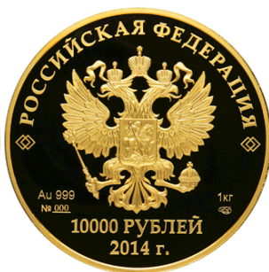
Прометей – 14