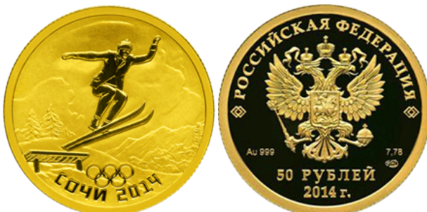
Прыжки на лыжах - 14

Аверс: в центре диска - рельефное изображение Государственного герба Российской Федерации, слева - обозначение вида металла и пробы сплава, справа - содержание металла в чистоте и товарный знак монетного двора, внизу у канта - горизонтальная надпись: "200 РУБЛЕЙ", под ней - дата: "2014 г."