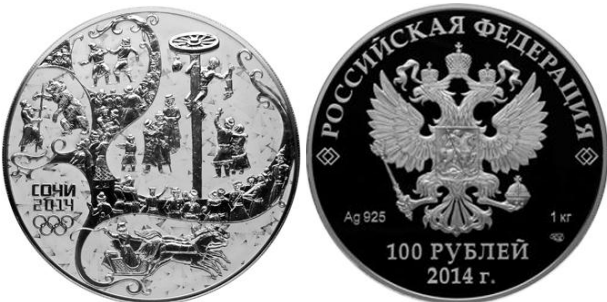
Столб – 14

Аверс: в центре диска - рельефное изображение Государственного герба Российской Федерации, слева - обозначение вида металла и пробы сплава, справа - содержание металла в чистоте и товарный знак монетного двора, внизу у канта - горизонтальная надпись: "100 РУБЛЕЙ", под ней - дата: "2014 г.".