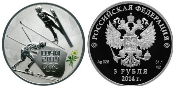
Двоеборье – 14

Реверс: в центральной части диска - рельефное изображение двух лыжников, также, в три строки - надпись: "СОЧИ", дата: "2014" и пять олимпийских колец, внизу слева, у канта - цветное изображение морозника кавказского.