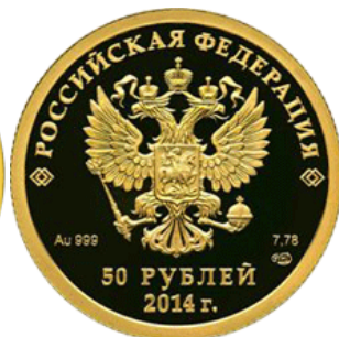
Фигурное – 14

Реверс: в центре матового диска - рельефное изображение участника соревнования по фигурному катанию – виду спорта, включенному в программу первых Олимпийских зимних игр, внизу имеются: пять олимпийских колец, под ними надпись "СОЧИ" и дата "2014".