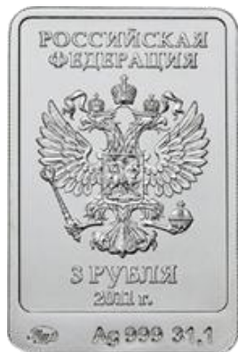
ЛП. Леопард - 11

На реверсе монеты расположено рельефное изображение Леопарда - официального талисмана XXII Олимпийских зимних игр 2014 года в г. Сочи, справа имеются: в две строки надпись "СОЧИ" и дата "2014", под ними – пять олимпийских колец.