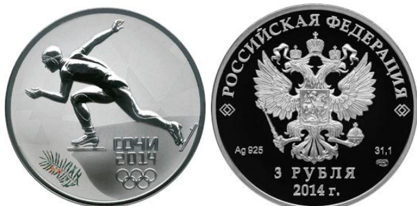
Коньки – 14

Реверс: в центральной части диска - рельефное изображение конькобежца, под ним в три строки - надпись: "СОЧИ", дата: "2014" и пять олимпийских колец, внизу слева, у канта - цветное изображение тиса ягодного.