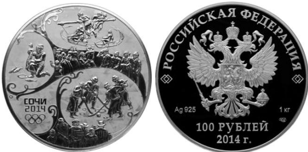
Котел - 14

Аверс: в центре диска - рельефное изображение Государственного герба Российской Федерации, слева - обозначение вида металла и пробы сплава, справа - содержание металла в чистоте и товарный знак монетного двора, внизу у канта - горизонтальная надпись: "100 РУБЛЕЙ", под ней - дата: "2014 г.".