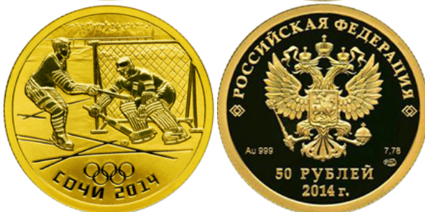
Хоккей - 14

Аверс: в центре диска - рельефное изображение Государственного герба Российской Федерации, слева - обозначение вида металла и пробы сплава, справа - содержание металла в чистоте и товарный знак монетного двора, внизу у канта - горизонтальная надпись: "50 РУБЛЕЙ", под ней - дата: "2014 г."