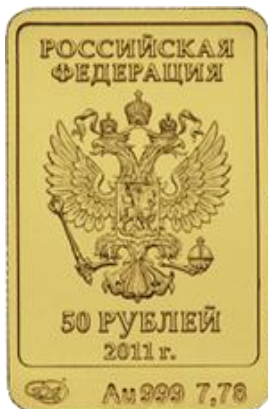
ЛП. Леопард - 11

На реверсе монеты расположено рельефное изображение Леопарда - официального талисмана XXII Олимпийских зимних игр 2014 года в г. Сочи, справа имеются: в две строки надпись "СОЧИ" и дата "2014", под ними – пять олимпийских колец.