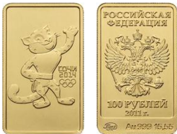
Л. Леопард - 11

На реверсе монеты расположено рельефное изображение Леопарда - официального талисмана XXII Олимпийских зимних игр 2014 года в г. Сочи, справа имеются: в две строки надпись "СОЧИ" и дата "2014", под ними – пять олимпийских колец.