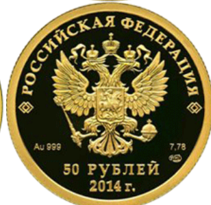
Конькобежный – 14

Реверс: в центре матового диска - рельефное изображение участника соревнования по конькобежному спорту – виду спорта, включенному в программу первых Олимпийских зимних игр, внизу имеются: пять олимпийских колец, под ними надпись "СОЧИ" и дата "2014".