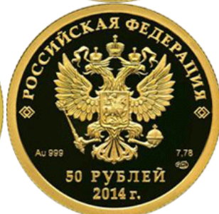
Лыжный – 14

Реверс: в центре матового диска - рельефное изображение участника соревнования по лыжному спорту – виду спорта, включенному в программу первых Олимпийских зимних игр, внизу имеются: пять олимпийских колец, под ними надпись "СОЧИ" и дата "2014".