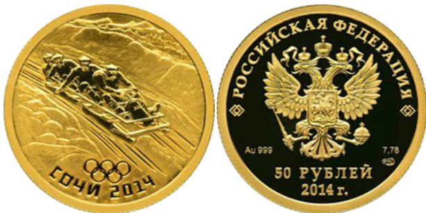
Бобслей – 14

Реверс: в центре матового диска - рельефное изображение четырех спортсменов, спускающихся на санях-бобах по трассе, обрамленной с обеих сторон снежными сугробами. На втором плане сверху - далекие горы, внизу - пять олимпийских колец, под ними вдоль канта - надпись, выполненная в технике "пруф": "СОЧИ 2014".