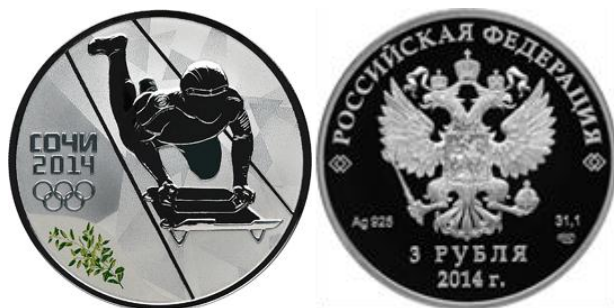
С. Скелетон - 14

Реверс: в центральной части диска - рельефное изображение скелетониста и выполненной в цвете ветки самшита, слева имеются: в две строки надпись "СОЧИ" и дата "2014", под ними – пять олимпийских колец.