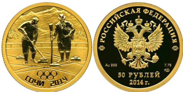
Керлинг – 14

Реверс: в центре матового диска - два спортсмена на ледовой площадке, рядом с ними - четыре камня (биты), один из спортсменов трет щёткой лед перед камнем, второй стоит с щёткой в руке, на втором плане - заснеженные горы, у подножия которых справа и слева - несколько хвойных деревьев; внизу - пять олимпийских колец, под ними вдоль канта - надпись, выполненная в технике "пруф": "СОЧИ 2014".