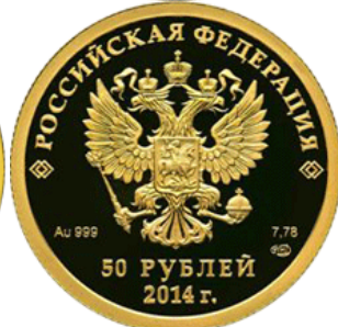
Биатлон – 14

Реверс: в центре матового диска - рельефное изображение участника соревнования по биатлону – виду спорта, включенному в программу первых Олимпийских зимних игр, внизу имеются: пять олимпийских колец, под ними надпись "СОЧИ" и дата "2014".