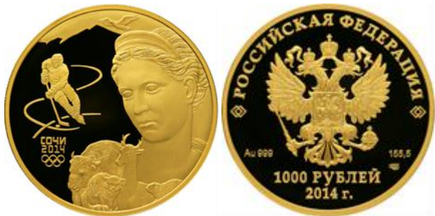
Фауна – 14

Реверс: в правой части диска – рельефное изображение античной богини Фауны, животных, обитающих в кавказско-черноморском регионе, и хоккеиста на фоне гор, справа имеются: в две строки надпись "СОЧИ" и дата "2014", под ними – пять олимпийских колец.