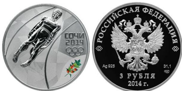
Санный – 14

Реверс: в центральной части диска - рельефное изображение саночника, справа в три строки - надпись: "СОЧИ", дата: "2014" и пять олимпийских колец, внизу слева, у канта - цветное изображение иглицы колхидской.