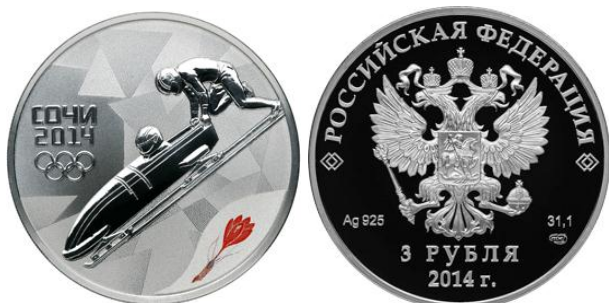
Бобслей – 14

Реверс: в центральной части диска - рельефное изображение двух бобслеистов, слева в три строки - надпись: "СОЧИ", дата: "2014" и пять олимпийских колец, внизу слева, у канта - цветное изображение шафрана Шарояна.