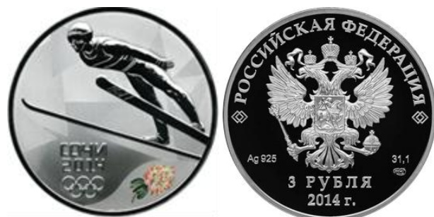
Т. Трамплин - 14

Реверс: в центральной части диска – рельефное изображение прыгуна на лыжах с трамплина, и выполненной в цвете ветки рододендрона, справа имеются: в две строки надпись "СОЧИ" и дата "2014", под ними – пять олимпийских колец.